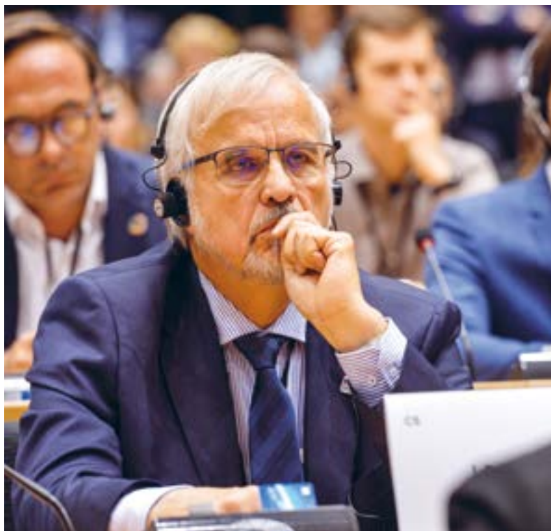
Na jednání Výboru pro zemědělství Evropského parlamentu, 2019