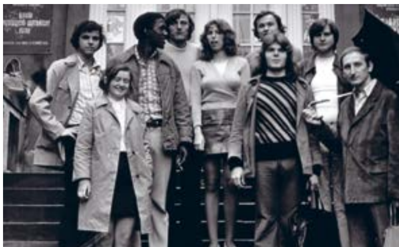
Lékařská fakulta, studijní kroužek č. 4 před promoci, 1978