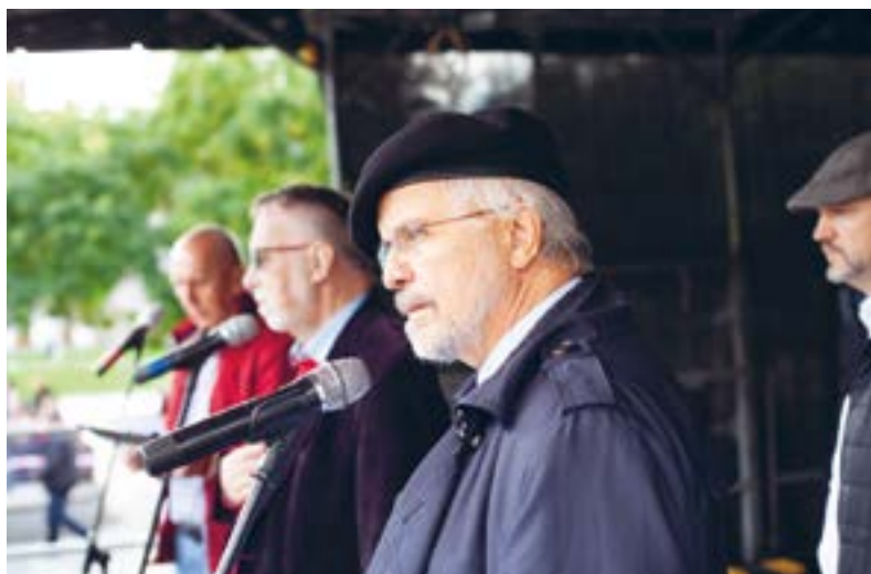
Shromáždění na podporu prezidentského kandidáta Jaroslava Bašty, 2022