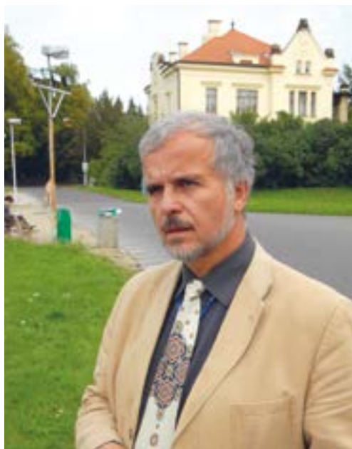
Náměstkem ředitele PN Bohnice, 2010