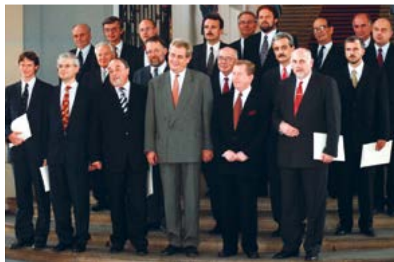
Vláda Miloše Zemana, 1998