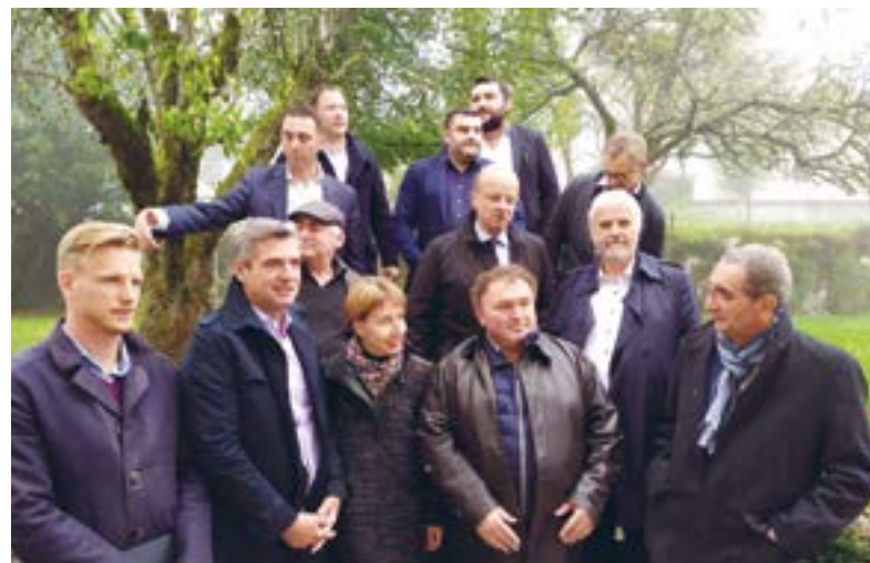
Exkurze Výboru pro zemědělství Evropského parlamentu ve Francii, 2019