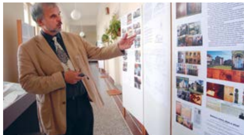
Kurátorem výstavy „Nemocná duše“ o psychiatrických muzeích v Evropě, 2010