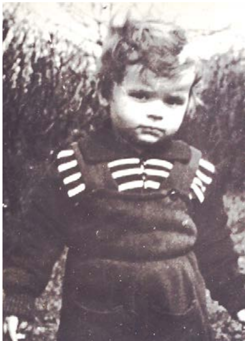
První fotografie, 1954