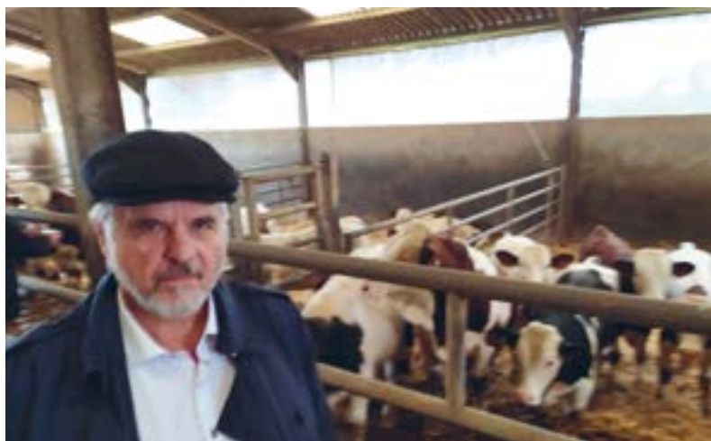
Země živitelka České Budějovice, výstava chovného skotu, 2020