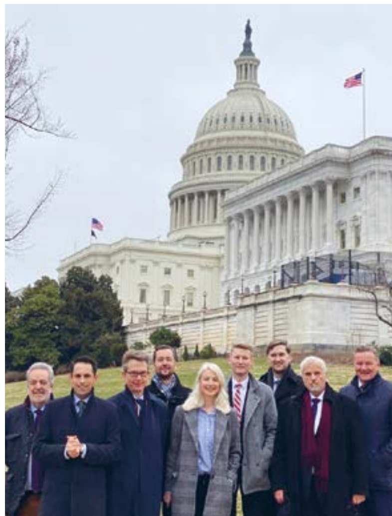
Návštěva frakce ID na sjezdu Republikánské strany Washington, 2020