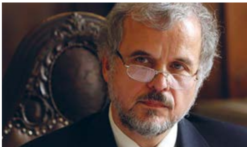
Ředitelem PN Bohnice, 2007