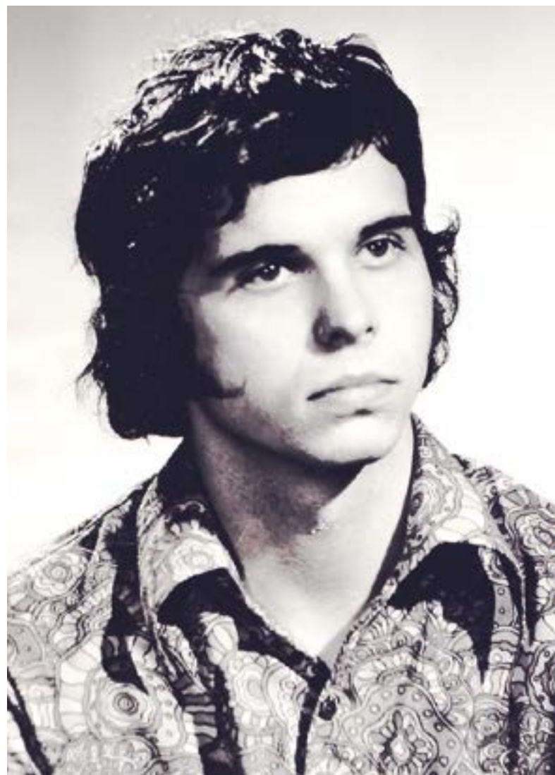
Fotografie z maturitního tableau, 1972